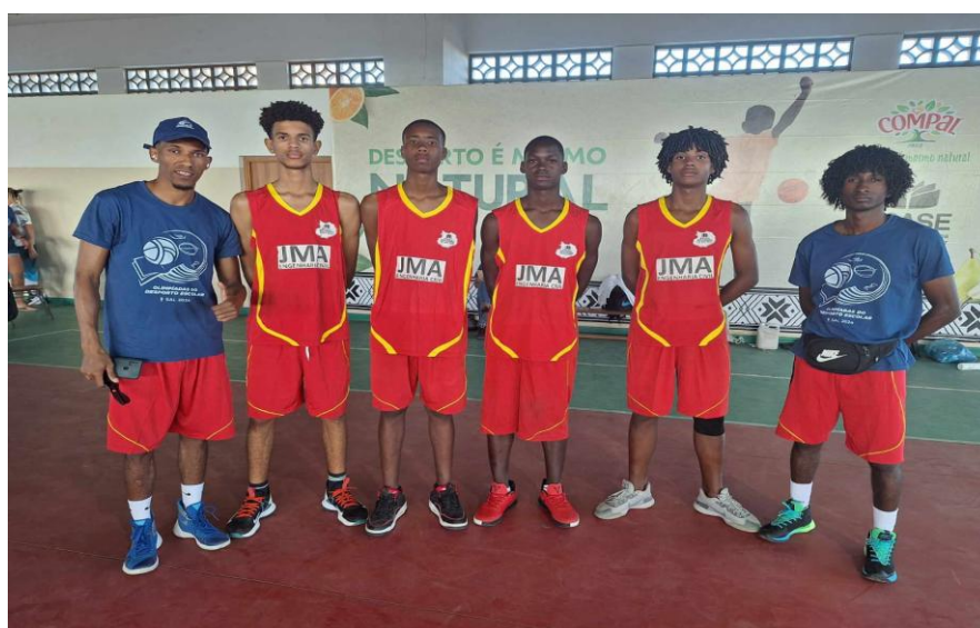
Figura 4- Equipa de Basquetebol 3x3 masculino sub16 da Escola Secundária da Boavista acompanhado dos Professores (ODE ilha do Sal 2024)

Importante realçar que nesta edição a equipa masculina subiu o pódio em 3º lugar, sendo a primeira conquista da equipa ao nível da modalidade de basquetebol na ilha da Boavista.