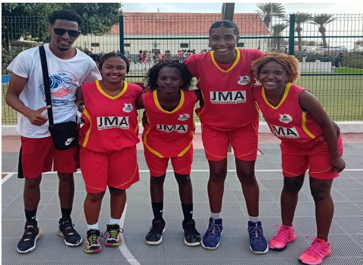
Figura 8- Equipa de Basquetebol 3x3 Feminino sub16 da Escola Secundária da Boavista acompanhado do Professor (ODE ilha de São Vicente 2025)

Ambas as equipas tiveram uma boa prestação, uma vez que atingiram a fase eliminar do torneio. A equipa feminina defrontou nas fases finais as duas melhores potências da modalidade de Basquetebol Cabo-verdiano, equipas da ilha de São Vicente e da Cidade da Praia, onde há uma cultura da prática do basquetebol superior às restantes das ilhas, oferecendo melhores recursos humanos e materiais para a sua prática. Nas meias-finais defrontou a equipa da Escola Secundária Amor de Deus a equipa vencedora do torneio, sofrendo uma derrota pela margem mínima de pontos, convertendo 8 pontos um a menos que o adversário que converteu 9 pontos. Na disputa pelo terceiro lugar também sofreu uma derrota pela margem mínima de pontos, convertendo 10 pontos um a menos que o adversário, a Escola Secundária Dr. José Augusto Pinto equipa anfitriã do torneio que converteu 11 pontos.