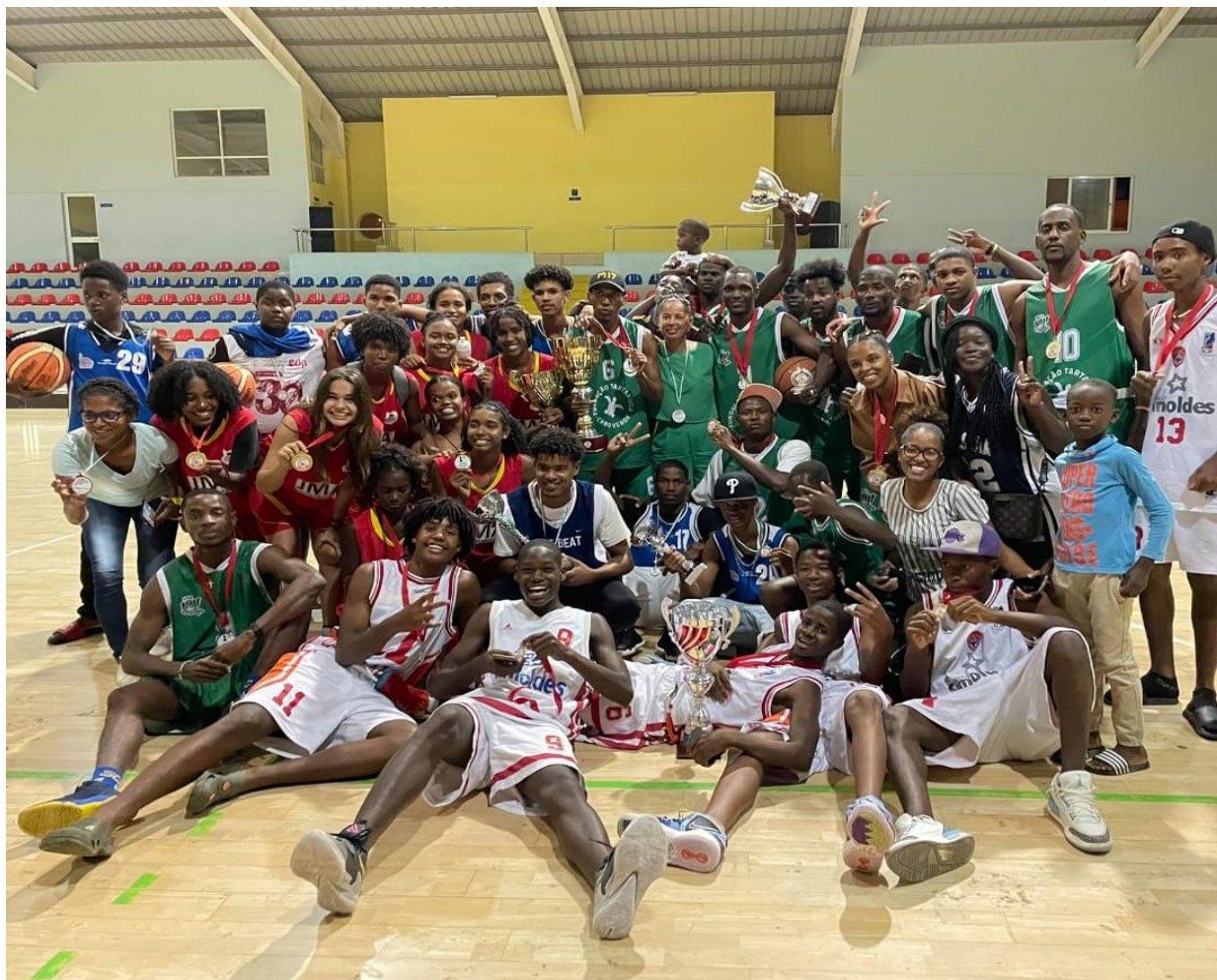
Figura 3- Equipas sub18, Sénior Masculino e Feminino de Basquetebol Campeões (Campeonato Regional da Boavista 2024)

Em 2024 foi realizada segunda edição das olimpíadas do desporto escolar na ilha do Sal, a equipa de Basquetebol 3x3 da Escola Secundária da Boavista participou mais uma vez com duas equipas (2) compostas por oito atletas (8), quatro novos atletas masculinos e quatro atletas femininos, sendo uma caloira.