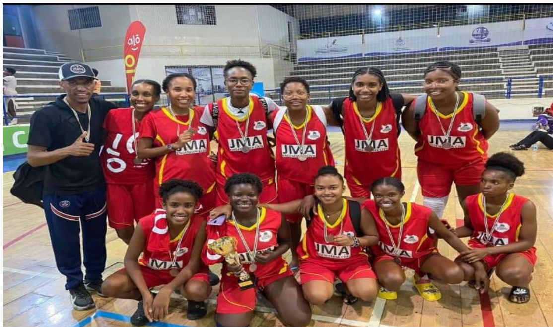
Figura 6- Equipa de Basquetebol Feminino da Escola Secundária da Boavista (Campeonato Nacional Sénior, Cidade da Praia 2023/2024) - 3ºLugar

No ano 2025 foi realizada a terceira edição na ilha de São Vicente, a equipa de Basquetebol 3x3 da Escola Secundária da Boavista participou novamente.