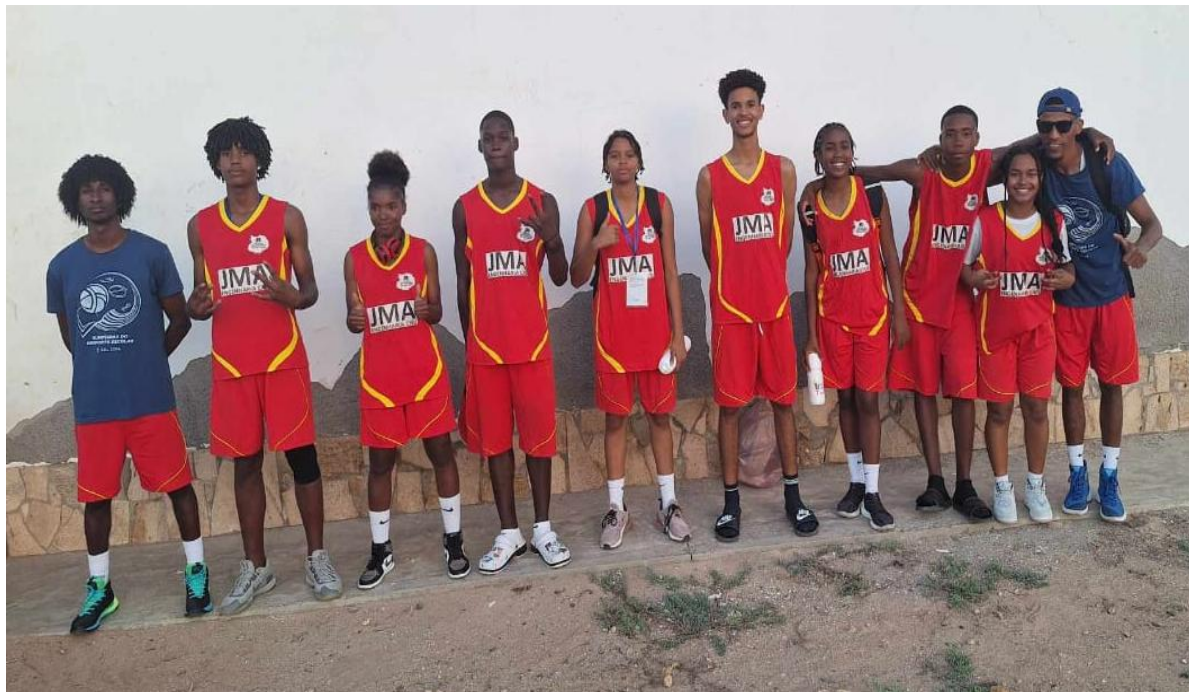
Figura 4- Equipa de Basquetebol 3x3 Masculino e Feminino sub16 da Escola Secundária da Boavista (ODE ilha do Sal 2024)

Importante realçar que nesta edição a equipa masculina subiu o pódio em 3º lugar, sendo a primeira conquista da equipa ao nível da modalidade de basquetebol na ilha da Boavista.