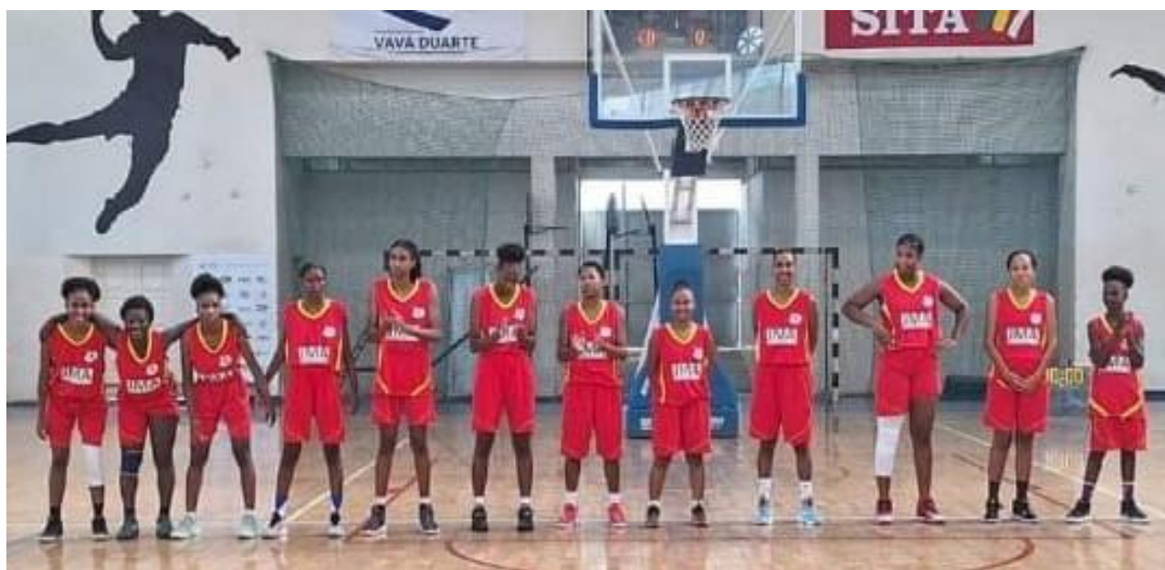
Figura 5- Equipa de Basquetebol da Escola Secundária da Boavista (Campeonato Nacional Sénior Feminino Cidade da Praia 2023/2024)

A grande aposta no desporto escolar gerou frutos, alavancando o campeonato regional de Basquetebol na ilha, fornecendo a maioria dos atletas para as equipas locais ADB Barraka e One Beat, neste mesmo ano a equipa feminina de Basquetebol da Escola Secundária da Boavista conseguiu um feito histórico no Campeonato Nacional Sénior Feminino, realizada na cidade da Praia, sendo a primeira equipa de Basquetebol na história da ilha a conquistar um troféu, ocupando o 3º lugar do pódio ao nível nacional, uma equipa estreante na competição, onde a maioria dos atletas apresentavam idade compreendida entre os 14 aos 18 anos, atletas que integram ao programa do Desporto Escolar das instituições e participaram nas Olimpíadas do Desporto Escolar , promovidas pelo Instituto do Desporto e da Juventude .