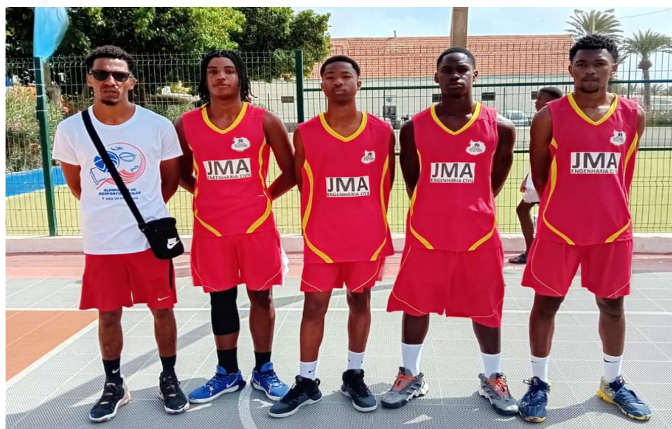
Figura 7- Equipa de Basquetebol 3x3 masculino sub16 da Escola Secundária da Boavista acompanhada do Professor (ODE ilha de São Vicente 2025)

No ano 2025 foi realizada a terceira edição na ilha de São Vicente, a equipa de Basquetebol 3x3 da Escola Secundária da Boavista participou novamente.