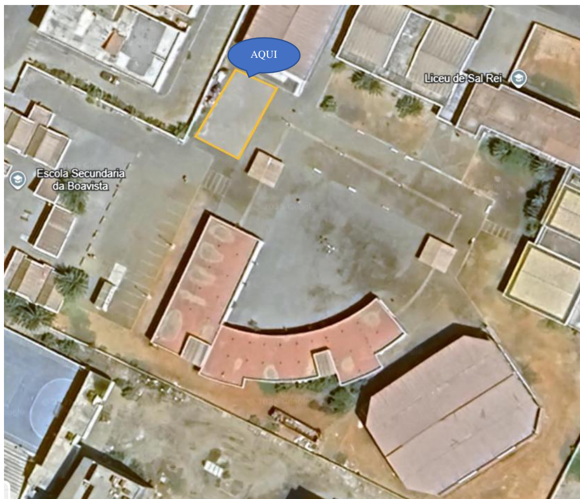
Figure 1 - Localização do projeto/Zona da implementação

8. Público-alvo: Alunos, professores, funcionários e comunidade educativa.