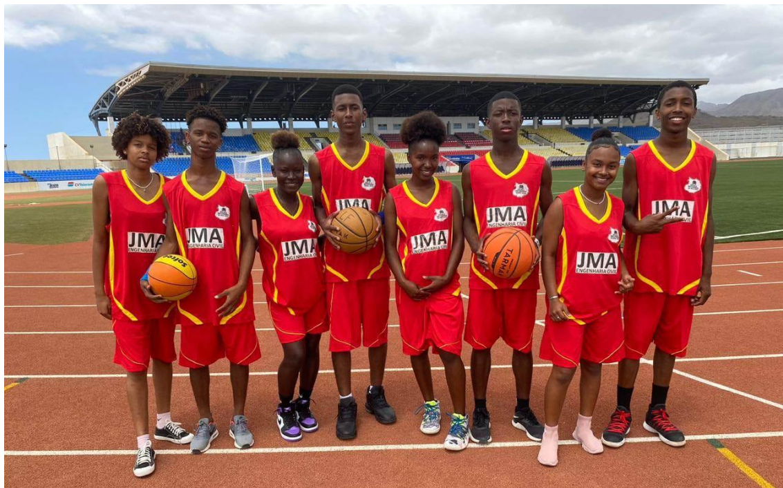
Figura 2- Equipa de Basquetebol 3x3 Masculino e Feminino sub16 da Escola Secundária da Boavista (ODE Cidade da Praia 2023)

No ano 2023 foi realizada a primeira edição na cidade capital do país (Praia).